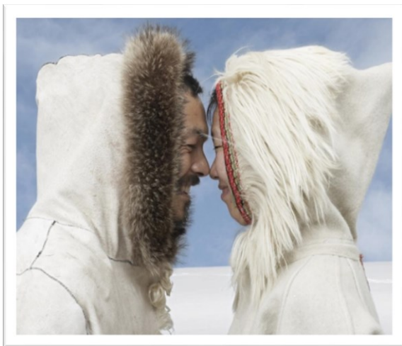
Изображение для раунда 4 вопрос 5