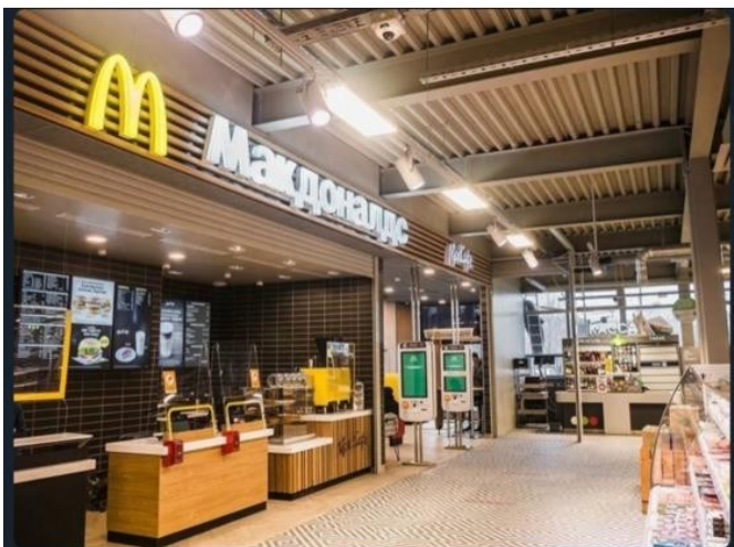
McDonald's в Москве пока продолжает работать.

Точной информации о дате временного закрытия ресторанов McDonald's на территории РФ нет - российский контактный центр McDonald's