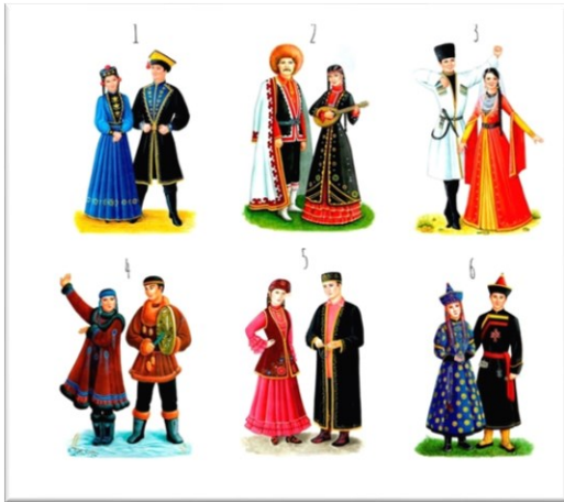
Изображение для раунда 1 вопрос 3